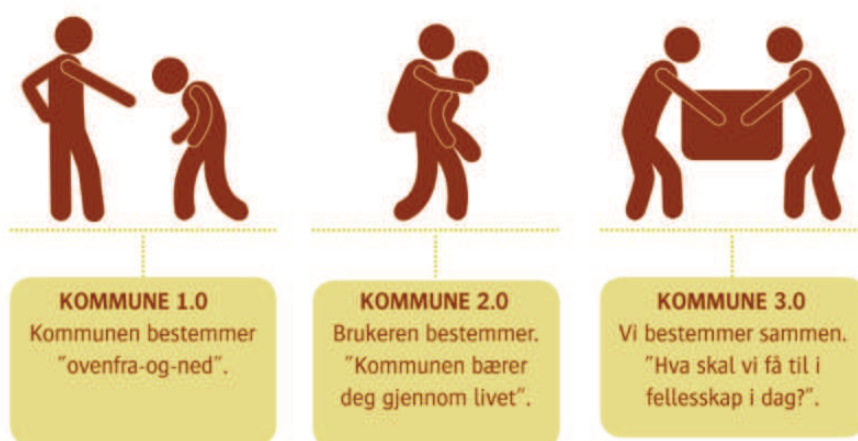
Figur 1: Synet på kommunens relasjon til innbyggerne endrer seg

eldre) utformes i samråd med innbyggerne. Tenkningen innebærer å involvere flere grupper (familie, naboer, offentlig tjenesteapparat, næringsliv og frivillige) og at man sammen har glede og nytte av bidra og tenke kollektivt om hvordan vi kan løse velferdsoppgaver; hva gjør vi på hvilken måte.