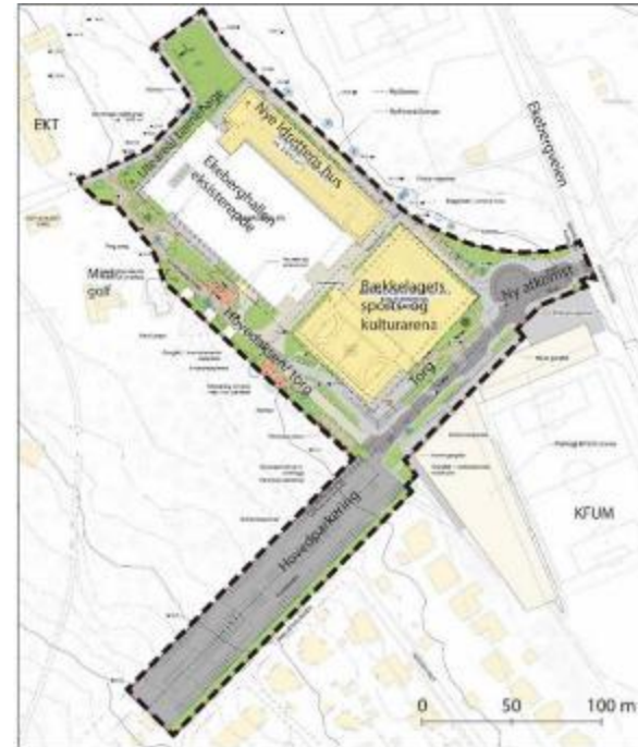
vedtas i bystyret 19.06.2019?